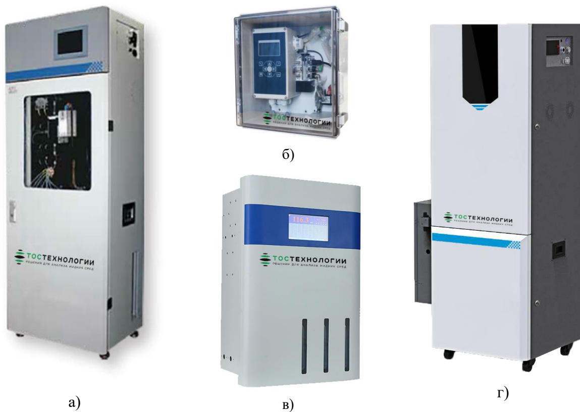
Общий вид анализаторов АКВАТОС-К (а, б, в), АКВАТОС-УИК (г)