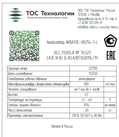
Рисунок 1 – Пример маркировочной таблички анализаторов АКВАТОС

Маркировочная табличка с серийным номером, наименованием анализатора, выполнена из алюминия и расположена на боковой поверхности анализатора. Вид маркировочной таблички представлен на рисунке 1, общий вид анализаторов – на рисунках 2 и 3. Серийный номер анализатора имеет цифровой формат и нанесен термопечатью.