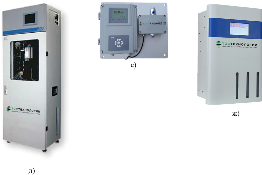
Общий вид анализаторов АКВАТОС-УФ (д, е), АКВАТОС-Т (ж)